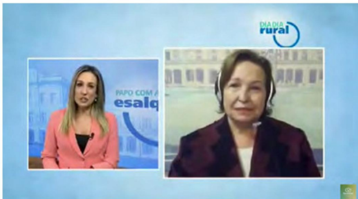
Papo com a Esalq

As parcerias para intercâmbio de conteúdo e coproduções, seja para o sinal aberto digital, seja para as plataformas digitais VOD, OTT ou Redes Sociais, é o caminho mais seguro e sustentável para atender um país gigante e diverso que consome muito audiovisual, seja em qual plataforma este for oferecido. E as TVs Universitárias estão cada vez mais dentro deste jogo.