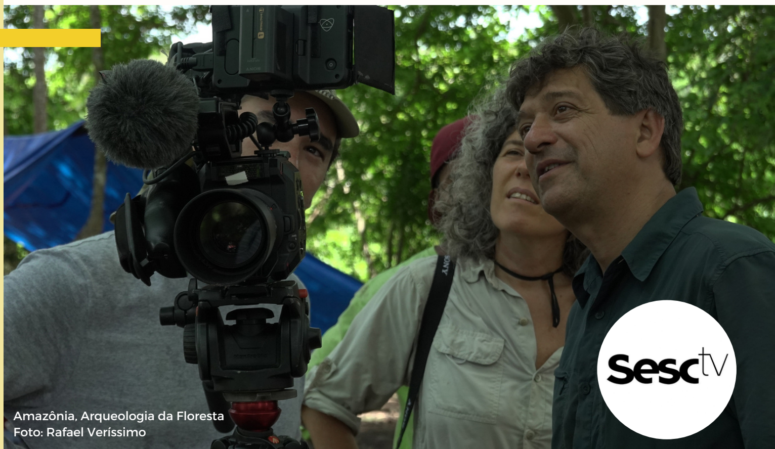
Amazônia, Arqueologia da Floresta

Associação Brasileira de Televisão Universitária