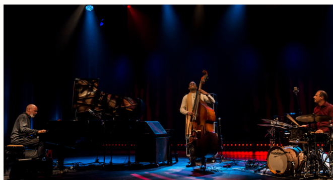
Mani Padme Trio se apresenta no Instrumental Sesc Brasil.